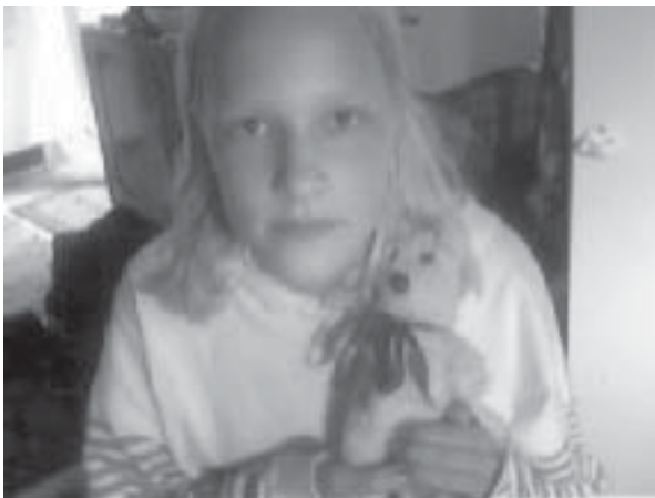
Pikku-nallen onnellinen omistaja.