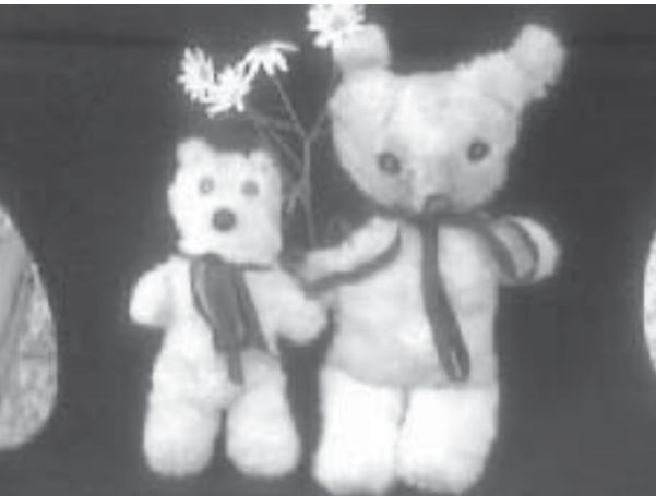
Vastasyntyneet Pikku-nalle ja Iso-nalle tyytyväisinä odottamassa haleja omistajiltaan.

Tässä Teemu ja Iso-nalle tutustuvat paremmin.