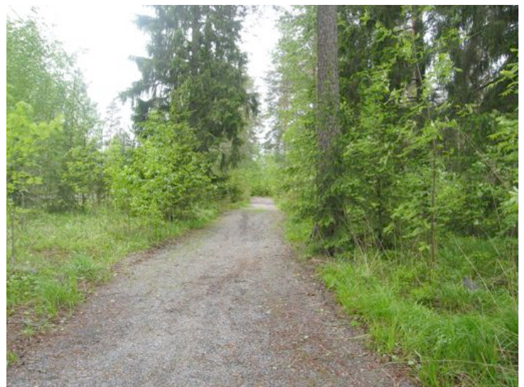
Kirkolle johtava metsäpolku

Toimittajamme kävivät kierroksella Anttolassa ja kuvasivat muummuassa Kunnantaloa ja kirkkoa. Kunnantalo on rauhallinen näin kesälomalla. Pääovi on komeasti kouluun päin suuntautunut. Jatkoimme kierrosta kirkolle. Menimme sinne metsäpolun kautta. Vaikka tie on aivan vieressä, on mukavampaa kulkea kirkkoon metsäpolkua pitkin. Siellä näkkee hyvän esimerkin Anttolan upeasta luonnosta. Itse kirkko on komea valkoinen rakennus, jossa on monta nurkkaa. Kirkkoa reunustavat sankarihaudat ja kivimuuri.