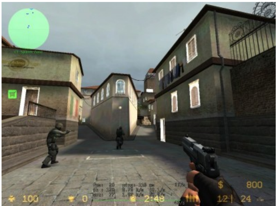
Kuva kentästä cs_italy