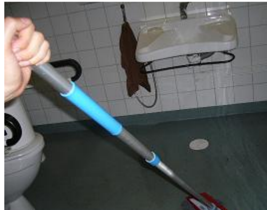
Vessassa tapahtunut katastrofi on mysteeri vielä tänäkin päivänä