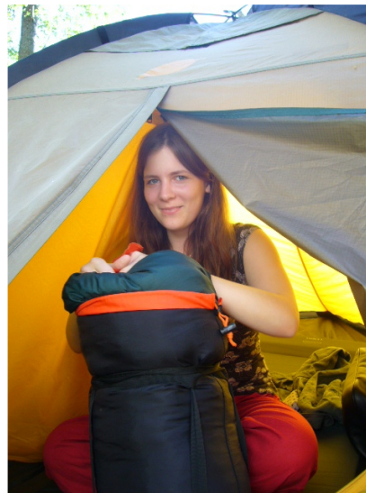
Virve pakkaa teltaansa.

Haastattelu ja kysymykset: Julia ja Venla Teksti: Artti