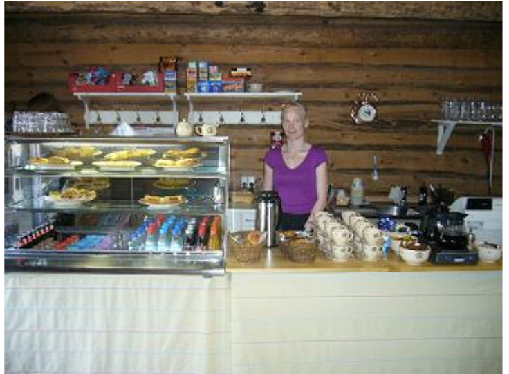
Myös Cafe Rantamakasiinin myyjätär kärsii vihollishyttysistä ja sanitettitilojen terroristeista

Oletteko tienneet että Kainuussa on Suolampi. Oikeasti se ei ole lampi vaan iso aukko maan uumeniin. Märkänä yönä sieltä nousee valtavia pilviä hyttysiä ja leviää ympäri Suomea salakavalasti. Päivisin niitä ei näy mutta illan hämärtyessä alkaa ininä. Sen kaikki tietää. Mutta miten se jatkuu teltassa. Kaikki väittää sulkeneensa aina nopeasti vetoketjun. Mutta kun silmät painuu kiinni, ininä kovenee. Mistä se johtuu? Osa hyttysistä on koulutettu vihollishyttysiksi ja niille on opetettu miten vetoketjut avataan äänettömästi.