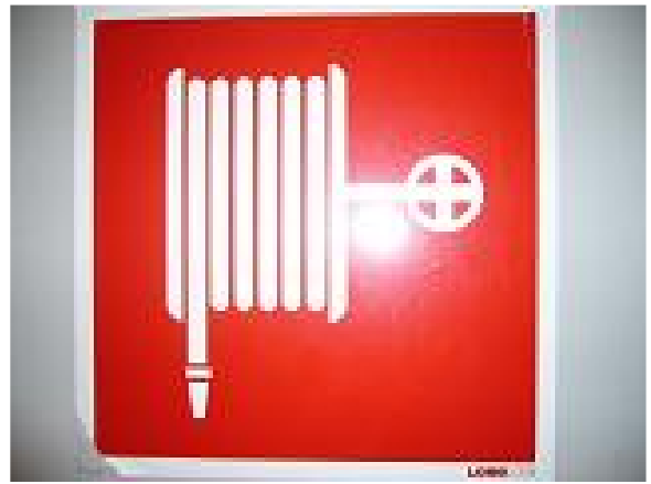
Arvoitus numero 2