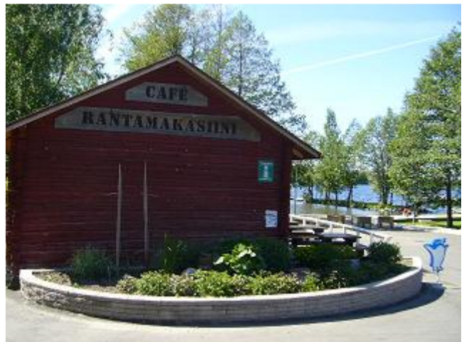
Cafe Rantamakasiinin ihastuttava piha