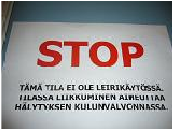
Arvoitus numero 1