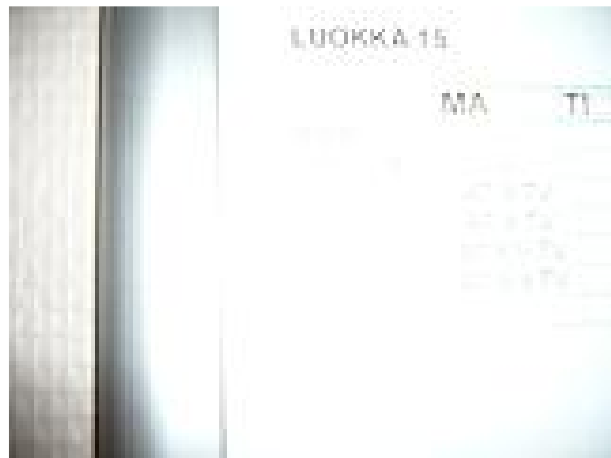
Arvoitus numero 5