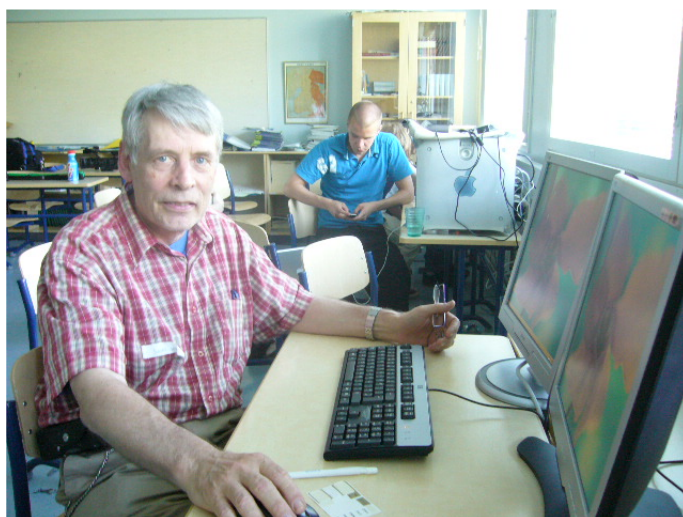
Kalusto on vuosien saatossa pienentynyt ja laatu parantunut.