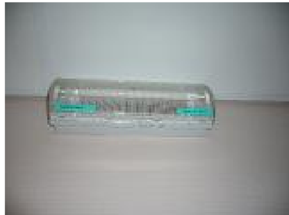
Arvoitus numero 4