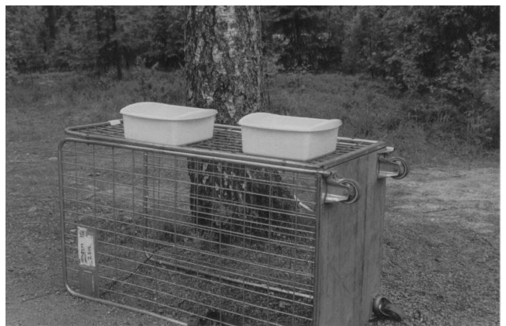
On sitä ennenkin tiskattu.