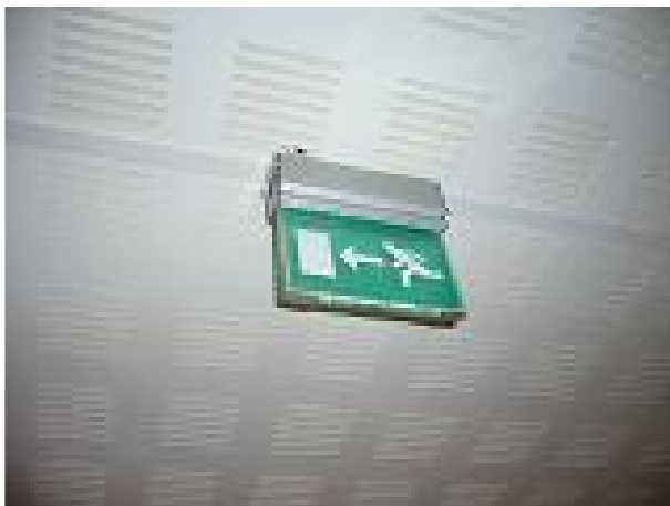
Arvoitus numero 3