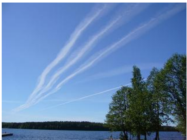
Hirvensalmen yli kulkee suosittu lentoreitti