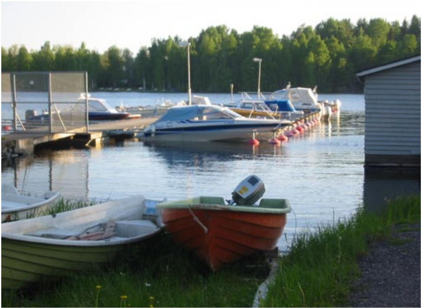
Kun väylä on kunnossa, näilläkin paateilla voi lähteä vaikka Nykkiin, jos kantti kestää...