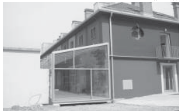
Youth hostel in Ljubljana, Slovenia