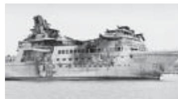
Saddam Hussein's yacht