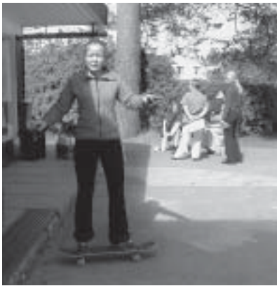
Raisa on paras