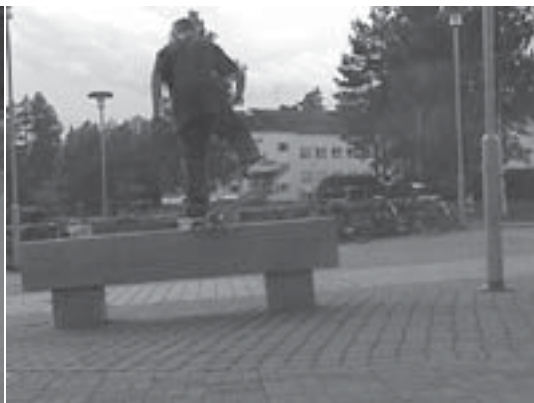
Grooged grind by:Anakin