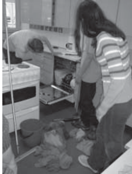
- "Hetken jo luulimme lopun koittaneen", kertoo paikalla ollut silminnäkijä.

Lopullisissa tutkimuksissa tulvan aiheuttajaksi osoittautui astianpesukone, joka selvinnee tapauksesta sakkorangaistuksella. Viranomaiset tutkivat asiaa.