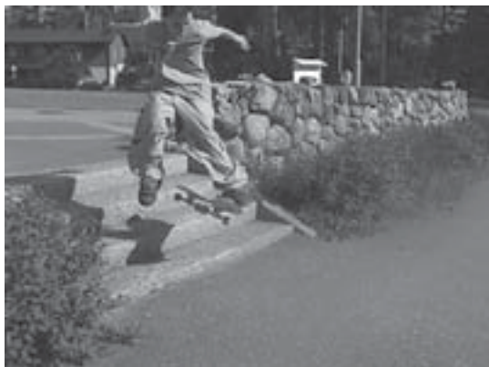
Almost kickflip by:Tumppi