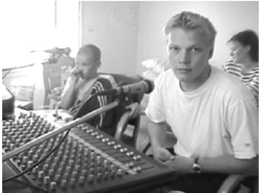
Radioväki keskittyy työhönsä