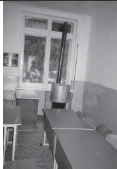
Luokkahuoneen kamiinaa kutsutaan "porvariksi" (bourgouise)

Äärifundamentaalisia ihmisiä tavattuani olen oivaltanut Neuvostoliiton häviämistä seuranneen yhteiskunnan hajoamisen ja sotien aiheuttaman koulutuksen puutteen edistäneen fundamentalismin leviämistä. Jos koulutilanne saa jatkua nykyisellään ja jotkut äärijärjestöt rahoittavat tuota kehitystä, tulee fundamentalismi nousemaan kukoistukseen maamme itänaapurin alueella. Ehdottamani hankkeet kohdistuvat ravitsemuksen ja terveydenhuollon puutteiden seurauksiin, erityisesti niihin, jotka liittyvät sodan aiheuttamiin vammoihin. Hankkeet ovat myös